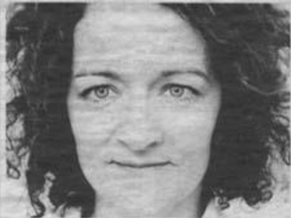
www.susannepoechacker.at: Das Kabarett beginnt um 19.30 Uhr