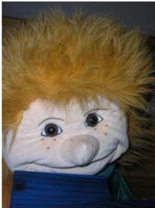
Abbildung 1: Handpuppe für Einzelarbeit

Die Erarbeitung dieser Themen erfolgt spielerisch. Angeboten werden Geschichten, spezifische Bilderbücher, themenbezogene Spiele, szenische Darstellung, kreatives Gestalten und Gespräche.