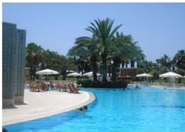
Abbildung 4: Urlaub in einem Club in der Türkei

Danke einer Urlaubsspende von Lauda Air konnte im Sommer eine Mutter mit ihren zwei Töchtern eine vergnügliche Reise in die Türkei erleben.