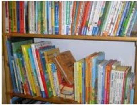
Abbildung 5: Bücher für die Kinder

Im Garten stehen den Kindern eine Rutsche mit Klettergerüst zur Verfügung sowie eine kleine Sandkiste, ein kleines Swimmingpool zum Abkühlen und einige Kinderräder. Die Spielmöglichkeiten im Gartenbereich sollen ebenfalls noch ausgebaut werden. Der Anfang dazu wurde im Herbst dieses Jahres mit einer Schaukel für Kleinkinder und Kinder gemacht.