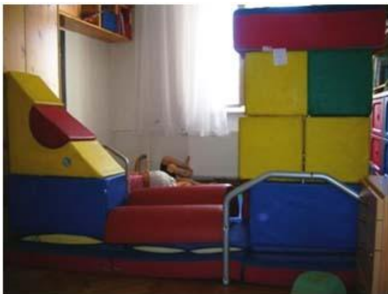
Abbildung 2: offenes Spielzimmer

Dieses Angebot ist bei den Kindern besonders beliebt und ermöglicht vor allem ein Erlernen der sozialen Kompetenzen sowie das Erleben offener Kommunikation. Hier werden auch neue Regeln im Umgang miteinander kennengelernt, erforscht und erprobt. Bewältigen von Stressreaktionen lässt sich im Miteinander ebenso gut üben. Ordnung und Zusammenhelfen sind weitere wichtige Bereiche.