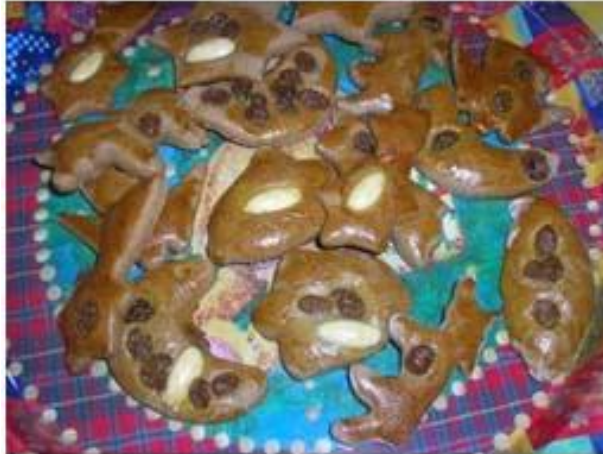
Abbildung 5: Lebkuchenbacken in der Adventzeit

Die Aufmerksamkeit wird von der Gewalterfahrung und Hilflosigkeit auf diese Weise immer mehr auf ihre Fähigkeiten und Kompetenzen gelenkt. Dadurch wird ihr Selbstwert gestärkt und sie können sich im Leben und in der Peergroup (Kindergarten, Schule, Freundeskreis) besser und mit adäquaten Mitteln behaupten.